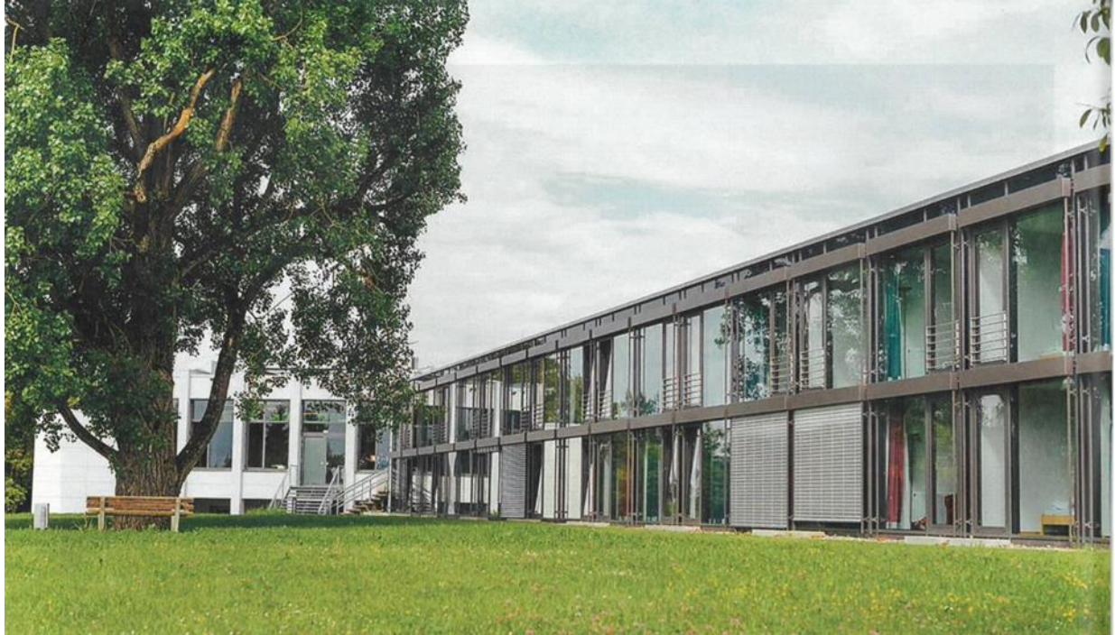
Académie fédérale Trossingen