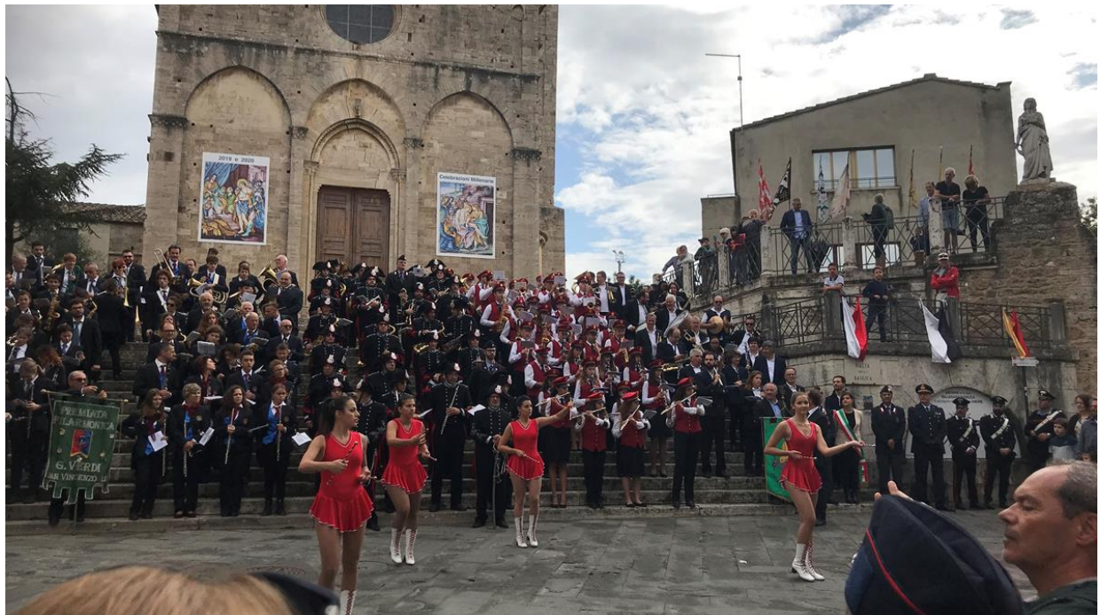
Music parade Asciano (I)

Heini Fülleemann CH-Weinfelden, May, 1-2018