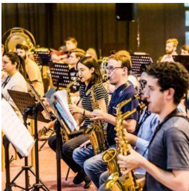
Schladming et Nussdorf-Debant 2019